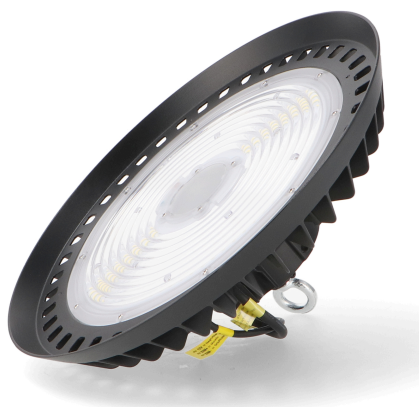
Tabla de Referencias