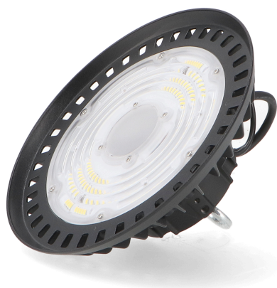
Tabla de Referencias