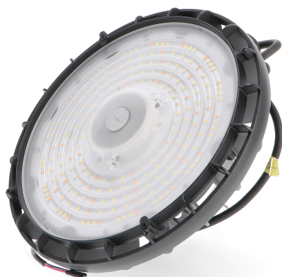
Tabla de Referencias