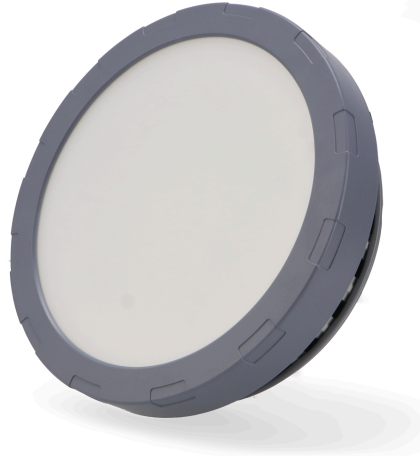
Tabla de Referencias