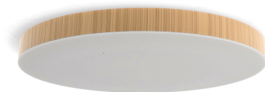
Tabla de Referencias