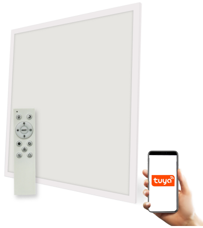
Tabla de Referencias