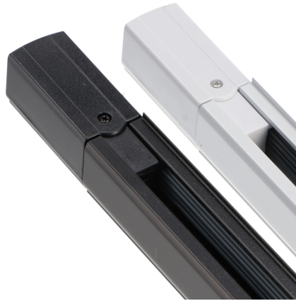
Tabla de Referencias