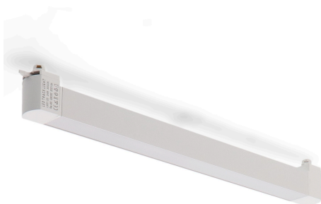
Tabla de Referencias